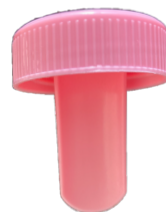
採材スプーンは蓋と一体となっています